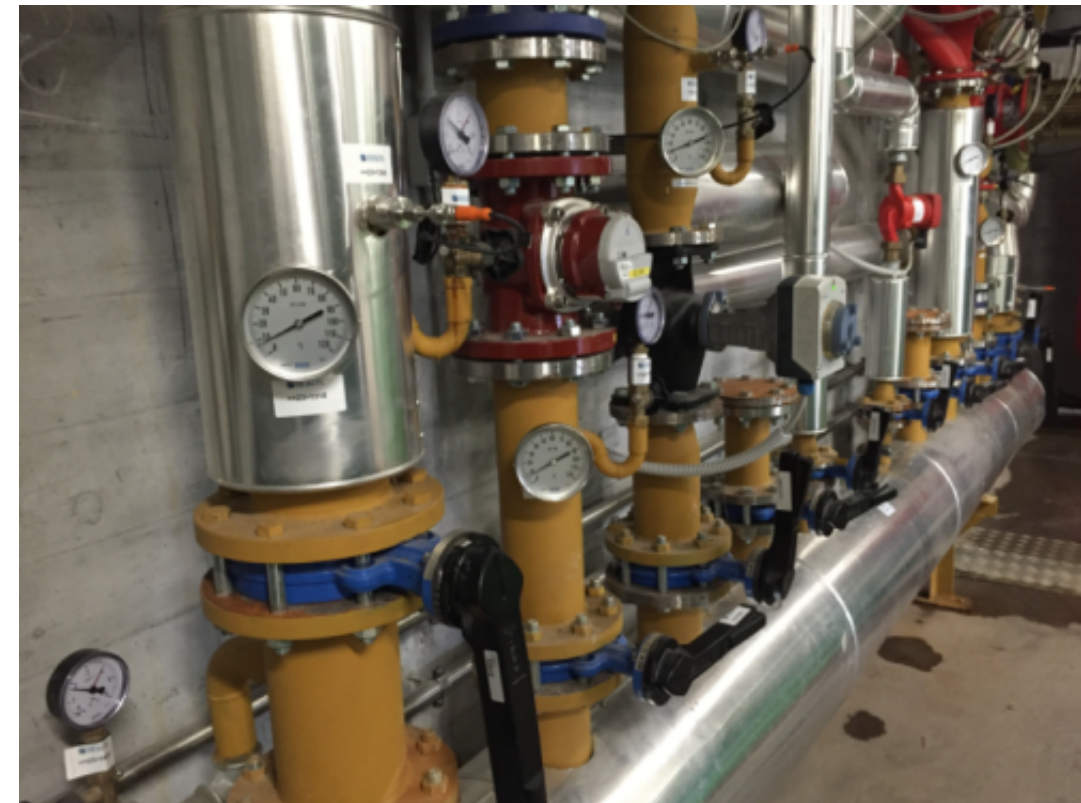
PRODUZIONE DI BIOGAS