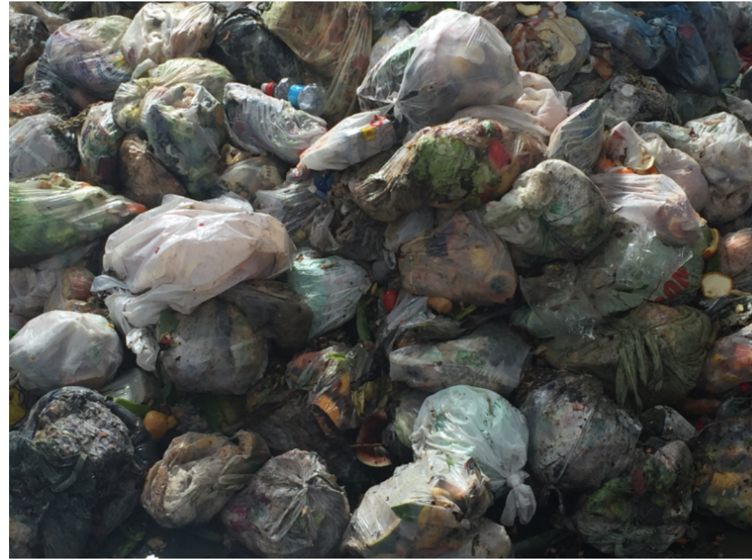
PRODUZIONE DELLE MISCELE